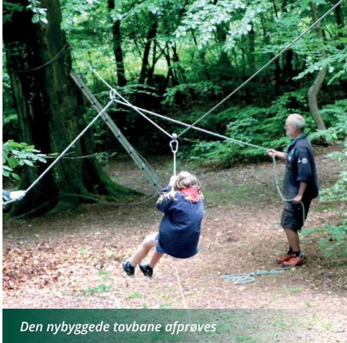
Den nybyggede tovbane afprøves

I Furesø har vi et meget aktivt foreningsliv. Vi ligger helt i toppen i Danmark med idrætstilbud og spejderliv. Denne førerplads skal vi bevare ved at sikre de frivillige foreninger gode faciliteter og støtte til økonomien. Det kommer mange-fold igen. Børn og unge dyrker fællesskab, udfordringer og aktivitet i foreningslivet, hvor man lærer at tage ansvar for sig selv og hinanden. Derved udvikles sundhed og demokratisk forståelse, som en forudsætning for godt medborgerskab. Aktive unge søger udfordringer – disse skal udleveres i vores frivillige foreninger. Det er den bedste sikkerhed mod øget tilslutning til bander og kriminalitet. ■