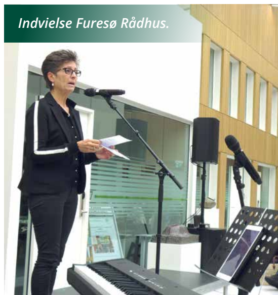
Indvielse Furesø Rådhus.

S ammen med ledere og medarbejderne vil vi konservative arbejde for, at vi får fjernet overflødige arbejdsgange og unødigt bureaukrati. Med øje for, at loven skal overholdes og borgerens retssikkerhed varetages, er målet, at medarbejderne får frigjort mest mulig tid til det, som giver mening og som har værdi for borgerne. Vi tror også på, at den stærkeste motivationsfaktor for en offentlig ansat ligger i at opleve at lykkes med sine opgaver. Opleve, at man har medvirket til at gøre en positiv forskel. Vi konservative vil vise alle vore ansatte tillid og møde dem med positive forventninger. Det indebærer naturligvis, at vi vil lægge stor vægt på løbende kompetenceudvikling, så borgere og samarbejdspartnere mødes af engagerede og kompetente ledere og medarbejdere, som trives. ■