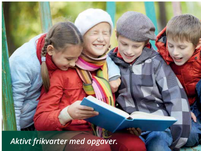
Aktivt frikvarter med opgaver.

Noget af det, jeg ser, er at vi skal udvise mere mod. Herunder skal vi turde stille krav og have forventninger til hinanden. Herunder til forældrene og familien. Men at stille krav kan ikke stå alene. Som kommune er det vores ansvar at gøre det muligt for forældre at møde disse forventninger. Et af de mål, jeg vil arbejde hårdt og målrettet for, når jeg kommer i Byrådet er, at forældre skal have tid til og mulighed for at være sammen med deres børn. Derfor skal børn, der gerne vil dyrke sport, ikke vente til efter en lang skoledag. Jeg vil arbejde for at få skabt trepartssamarbejde mellem skole, foreninger og FFO, så familietiden tilhører familien. ■